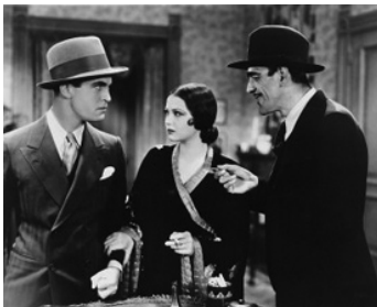
1932 THE MIRACLE MAN de Norman Z. McLeod avec Chester Morris