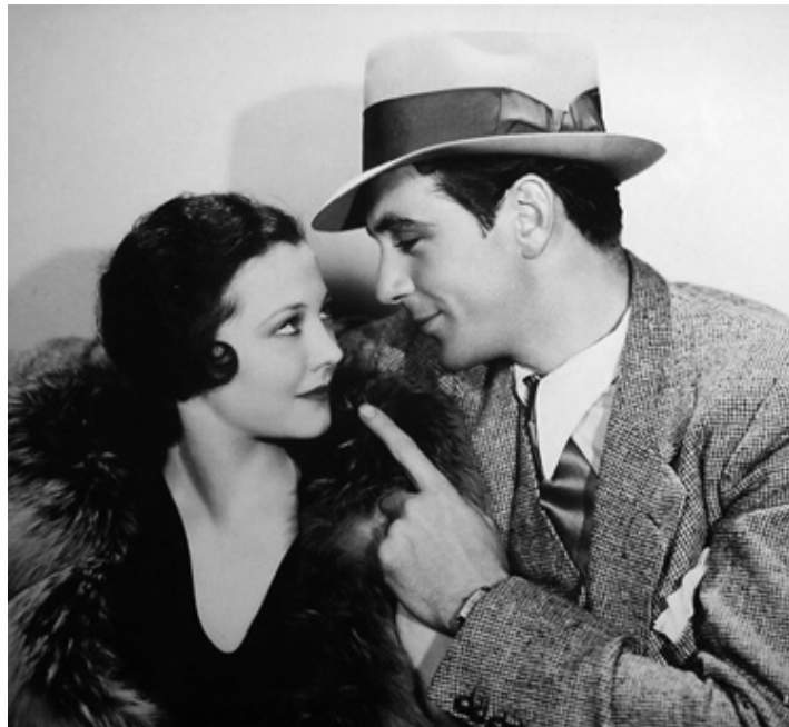
1931 LES CARREFOURS DE LA VILLE (City Streets) de Rouben Mamoulian avec Gary Cooper