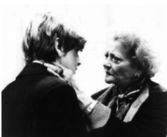
1977 DAMIEN, LA MALÉDICTION II (Omen II) de Don Taylor avec Jonathan Scott-Taylor