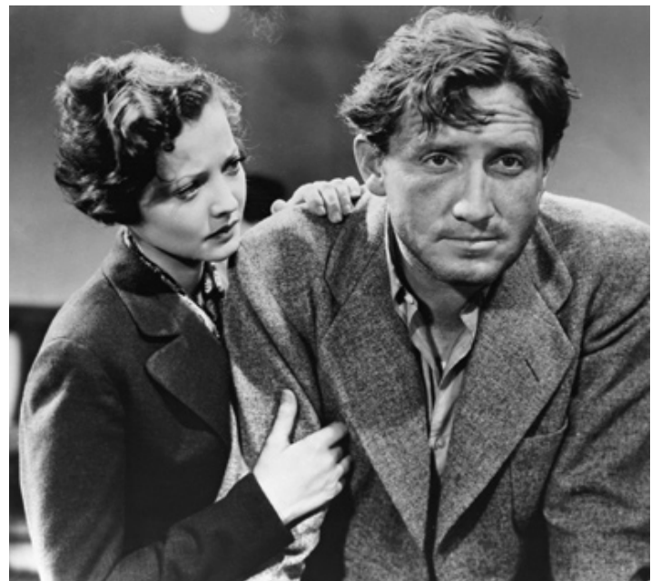
1936 FURIE (Fury) de Fritz Lang avec Spencer Tracy