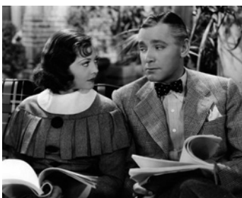
1935 ACCENT ON YOUTH de Wesley Ruggles avec Herbert Marshall