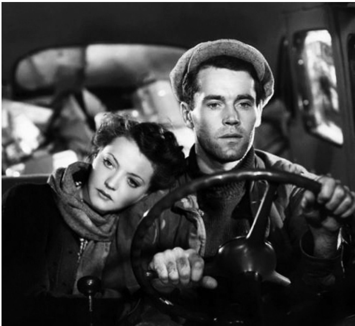
1937 J'AI LE DROIT DE VIVRE (You only live once) de Fritz Lang avec Henry Fonda