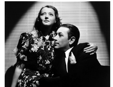
1938 CASIER JUDICIAIRE (You and Me) de Fritz Lang avec George Raft