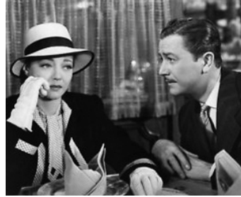
1946 UN FILS ACCUSE ((The Searching Wind) de William Dieterle avec Robert Young