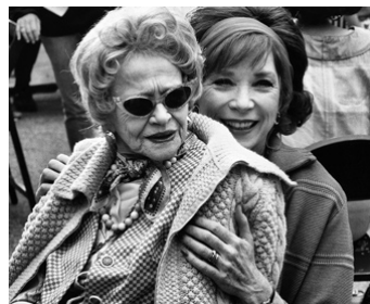
1992 QUATRE NEW-YORKAISES (Used People) de Beeban Kidron avec Shirley MacLaine