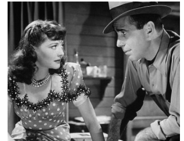
1941 L'AMOUR ET LA BÊTE (The Wagons roll at night) de Ray Enright avec Humphrey Bogart