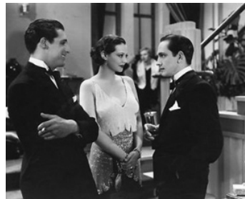
1932 MERRILY WE GO TO HELL de Dorothy Arzner avec Cary Grant, Fredric March