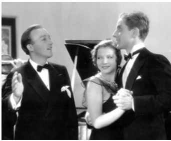
1930 CONFESSION OF A CO-ED de David Burton et Dudley Murphy avec B. Crosby, Ph. Holmes