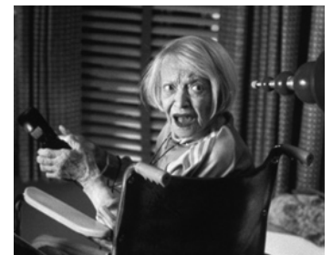
1996 MARS ATTACKS ! (Mars attacks !) de Tim Burton