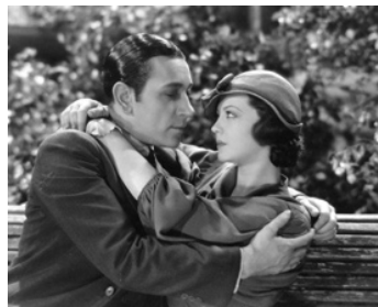
1933 PICK-UP (Pick up) de Marion Gering avec George Raft