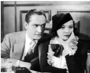
1933 GOOD DAME de Marion Gering avec Fredric March