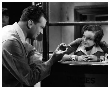
1936 AGENT SECRET (Sabotage) d'Alfred Hitchcock avec John Loder