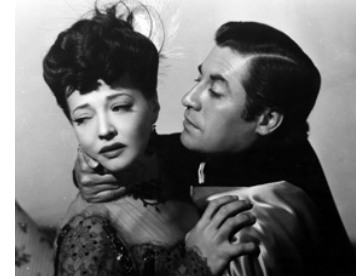
1947 L'AMOUR D'UN INCONNU (Love from a Stranger) de Richard Whorf avec John Hodiak