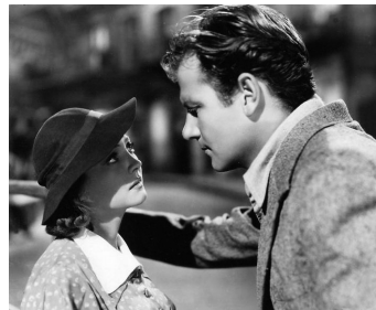
1937 RUE SANS ISSUE (Dead End) de William Wyler avec Joel McCrea