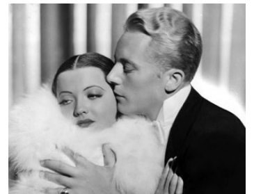
1934 LA MÉTISSSE (Behold my Wife) de Mitchell Leisen avec Gene Raymond