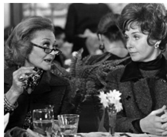
1973 DÉSIRES D'ÉTÉ, RÊVES D'HIVER (Summer wishes, winter dreams) de G. Gates avec Joanne Woodward