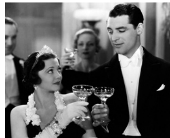
1934 PRINCESSE PAR INTÉRIM (Thirty Day Princess) de Marion Gering avec Cary Grant