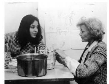
1977 I NEVER PROMISE YOU A ROSE GARDEN d'Anthony Page avec Kathleen Quinlan