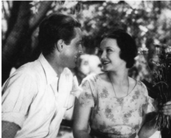
1931 UNE TRAGÉDIE AMÉRICAINNE (An American Tragedy) de J. von Sternberg avec Ph. Holmes