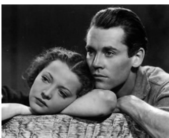
1935 LA FILLE DU BOIS MAUDIT (The Trail of the Lonesome Pine) d'H. Hathaway avec H. Fonda