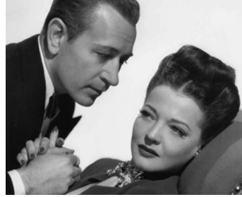
1946 LE GANGSTER ET LA LADY (Mr Ace) d'Edwin L. Marin avec George Raft