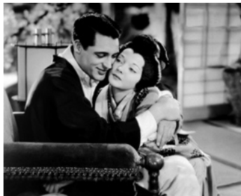
1932 MADAME BUTTERFLY (Madame Butterfly) de Marion Gering avec Cary Grant