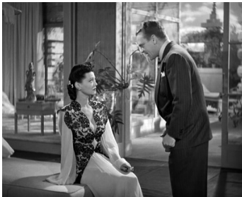
1945 DU SANG DANS LE SOLEIL (Blood on the Sun) de Frank Lloyd avec James Cagney