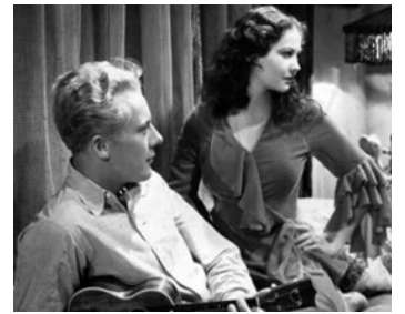
1931 PÉNITENCIER DE FEMMES (Ladies of the Big House) de M. Gering avec Gene Raymond