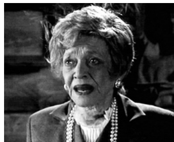
1987 BEETLEJUICE (Beetle Juice) de Tim Burton