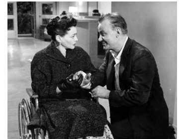
1956 UN INNOCENT VA MOURIR (Behind the high Wall) d'Abner Biberman avec Tom Tully