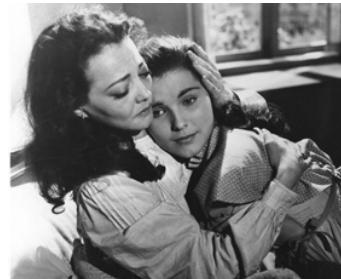
1952 LA VIE DE JEAN VALJEAN (Les Misérables) de Lewis Milestone avec Debra Paget