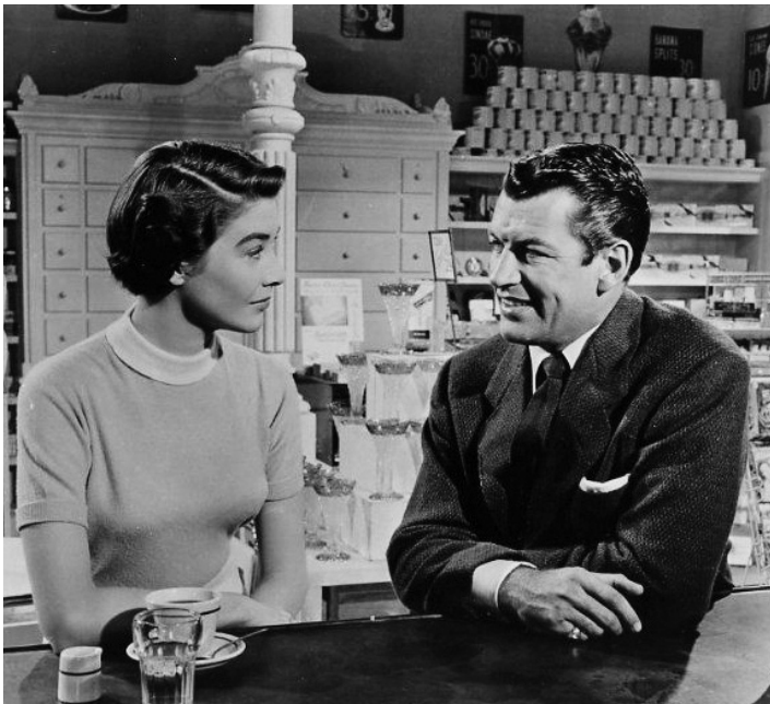
1955 LES INCONNUS DANS LA VILLE (Violent Saturday) de Richard Fleischer avec Richard Egan