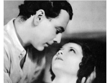
1931 SCÈNE DE LA RUE (Street Scene) de King Vidor avec William Collier Jr